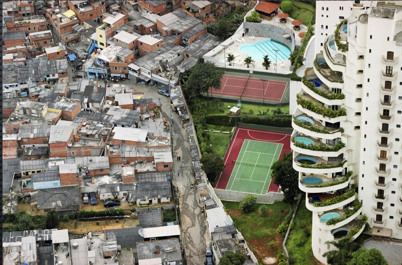
Axel Kaiser: El espejismo de la justicia social.