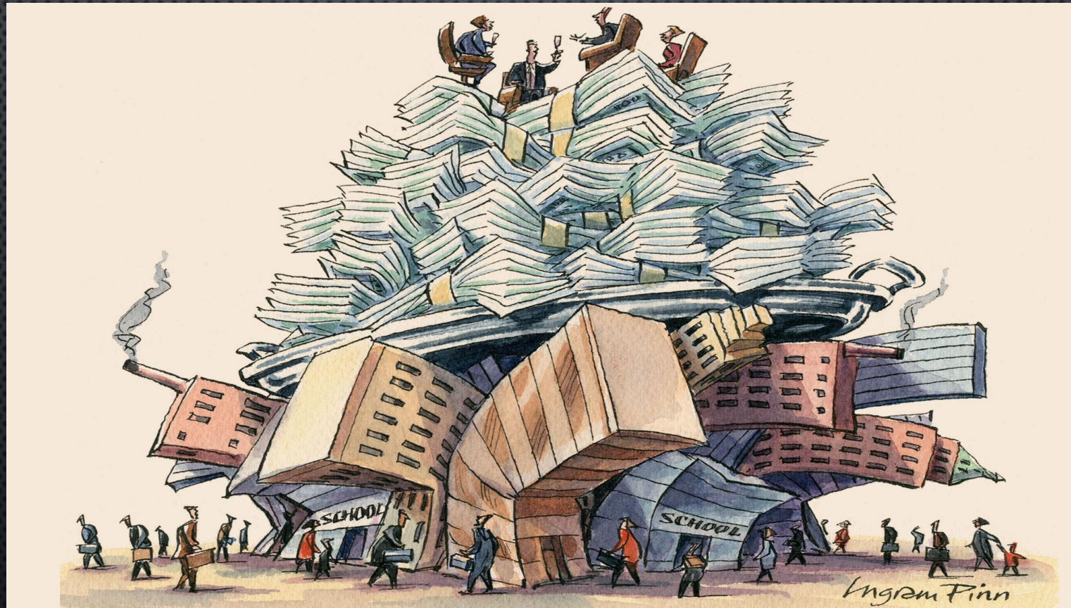
Axel Kaiser: El espejismo de la justicia social.