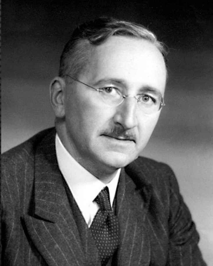
Axel Kaiser: El espejismo de la justicia social.

“Del hecho de que las personas son muy diferentes se deduce que, si las tratamos por igual, el resultado debe ser la desigualdad en su posición real, y que la única forma de colocarlas en una posición igual sería tratarlas de manera diferente. Por tanto, la igualdad ante la ley y la igualdad material no solo son diferentes, sino que están en conflicto entre sí; y podemos lograr uno u otro, pero no ambos al mismo tiempo.”