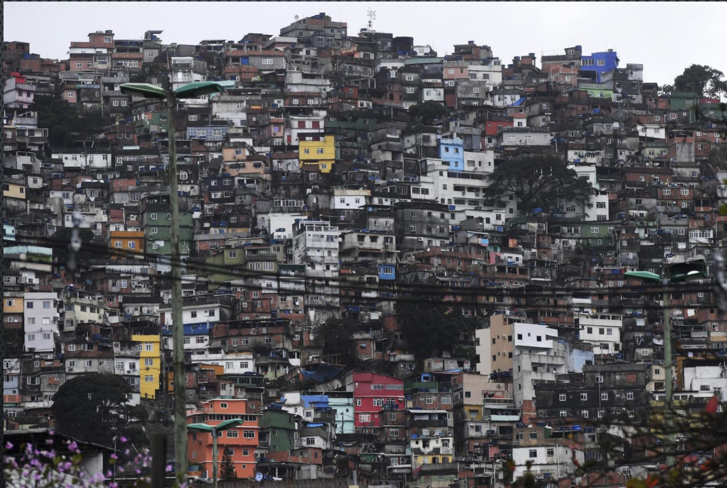
Axel Kaiser: El espejismo de la justicia social.